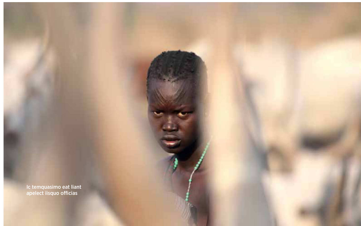
Ic temquasimo eat liant apelect iisquo officias