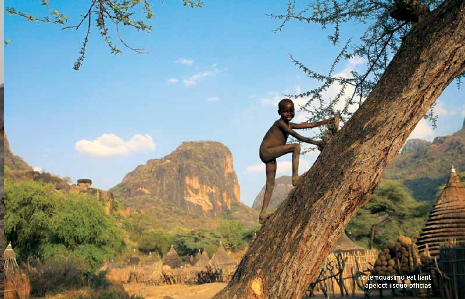
Ic temquasimo eat liant apelect iisquo officias