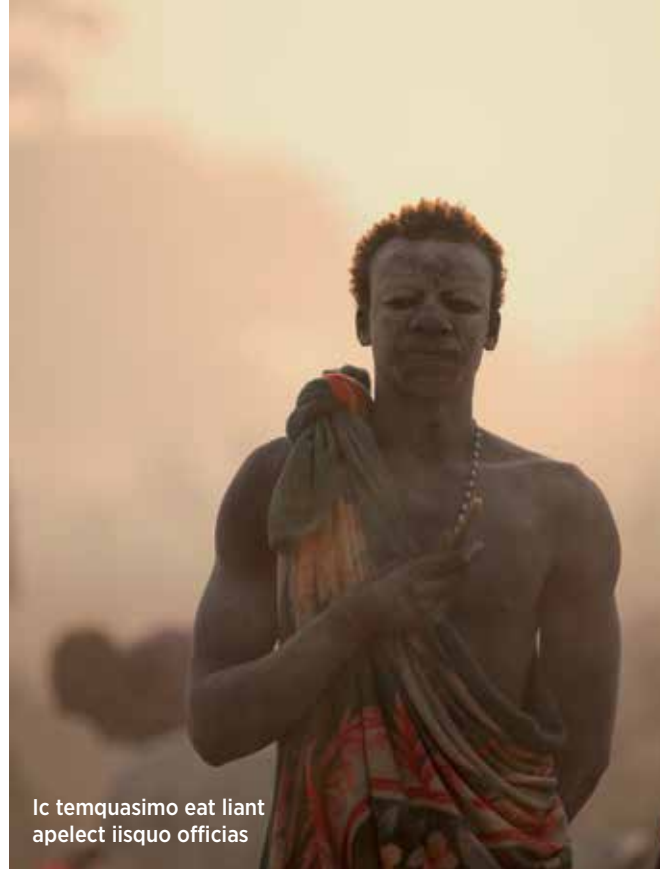
Ic temquasimo eat liant apelect iisquo officias