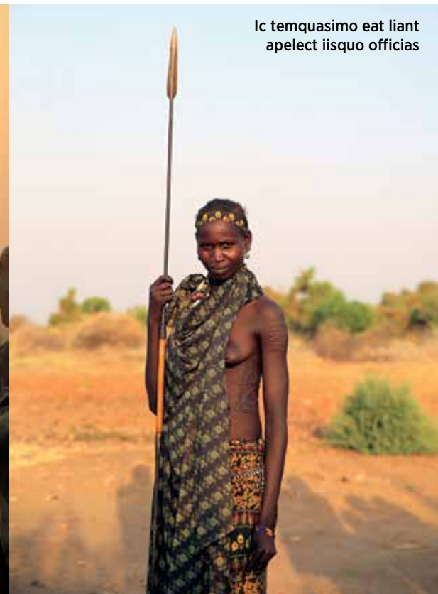
Ic temquasimo eat liant apelect iisquo officias