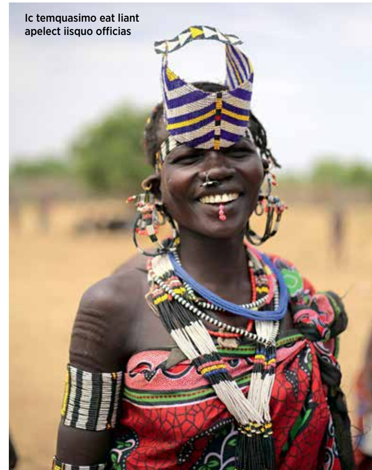
Ic temquasimo eat liant apelect iisquo officias