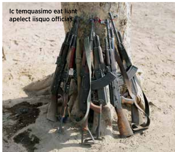
Ic temquasimo eat liant apelect iisquo officias

Všemi směry tu vedou jen nebezpečné prашné cesty. Po jedné z nich teď mřívme na sever, zhruba 75 kilometrů. Ve zpětném zrcátku bílé toyoty pozoruji vířící se oblak prachu, který za sebou zanechávám. Bez jakéhokoliv značení se stále více ztrácím na jedné z mnoha identických polních cestiček kopírujících hlavní cestu. Sjíždíme stále hlouběji do porostu a já cítím, jak ve mně narůstá vzrušení z blízkého setkání. Blížíme se totiž k lidem, o kterých jsem tolik četl a poznával je v představách.