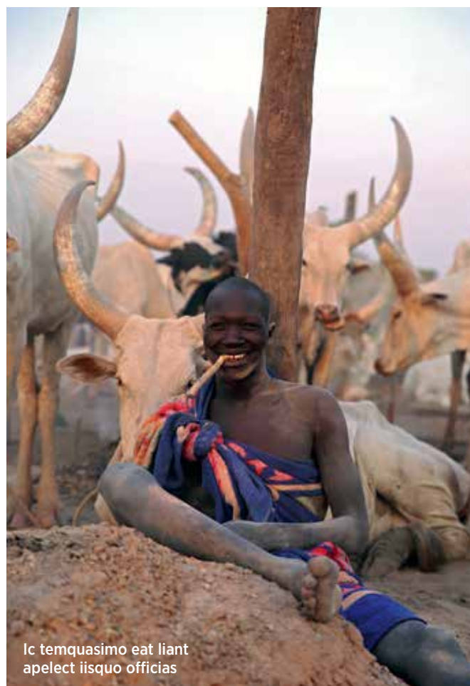
Ic temquasimo eat liant apelect iisquo officias