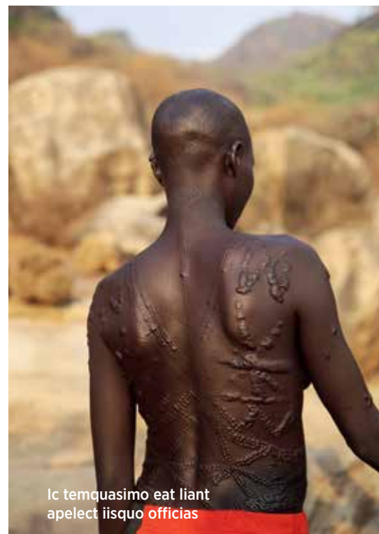
Ic temquasimo eat liant apelect iisquo officias