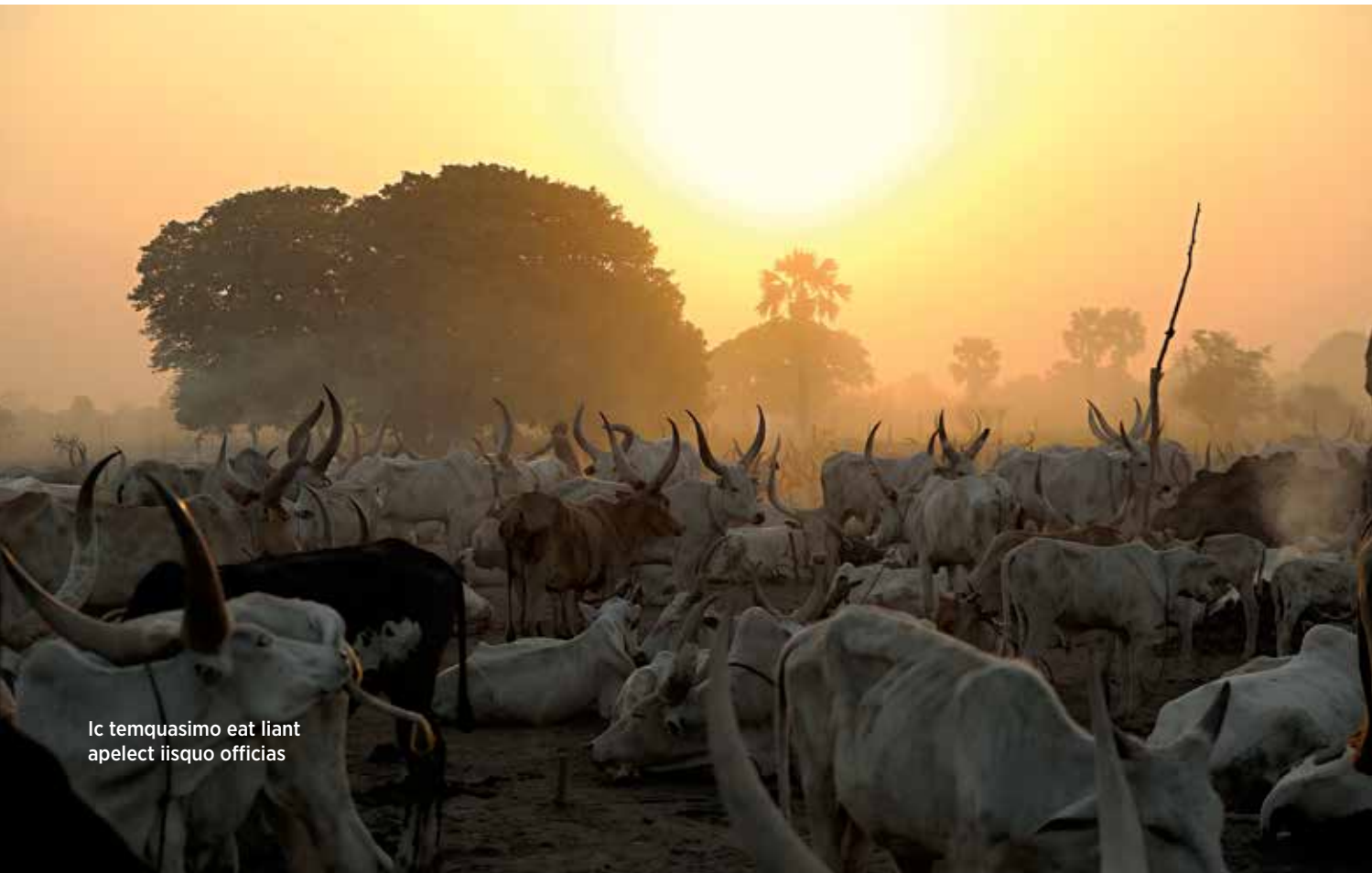
Ic temquasimo eat liant apelect iisquo officias