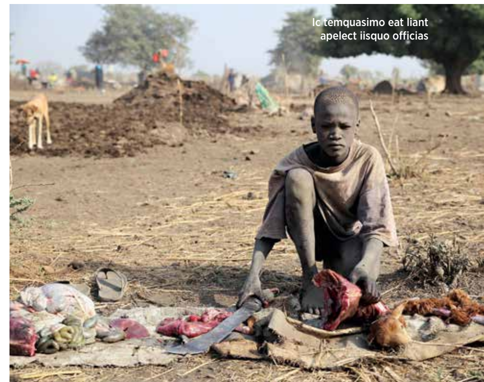
Ic temquasimo eat liant apelect iisquo officias