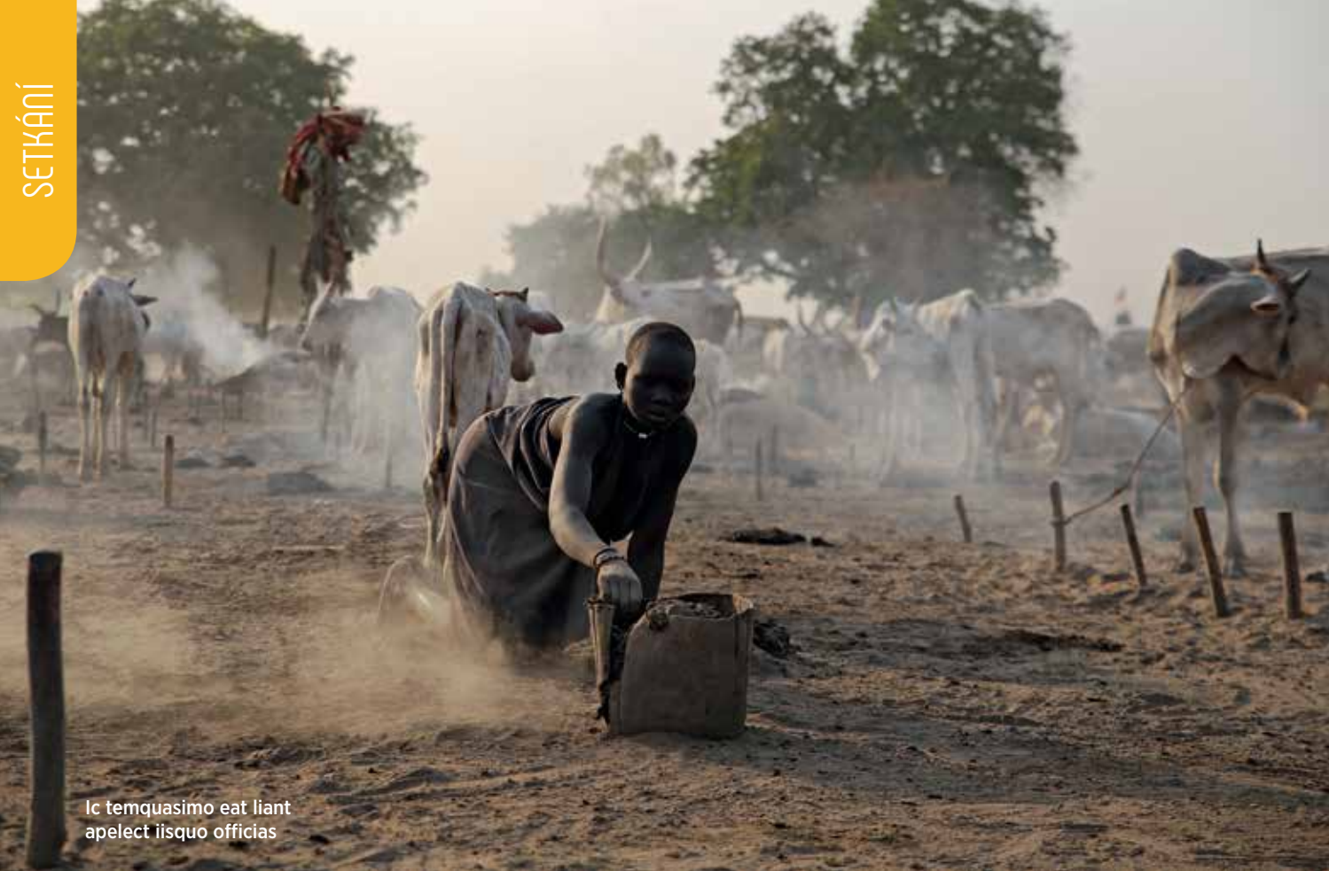
Ic temquasimo eat liant apelect iisquo officias