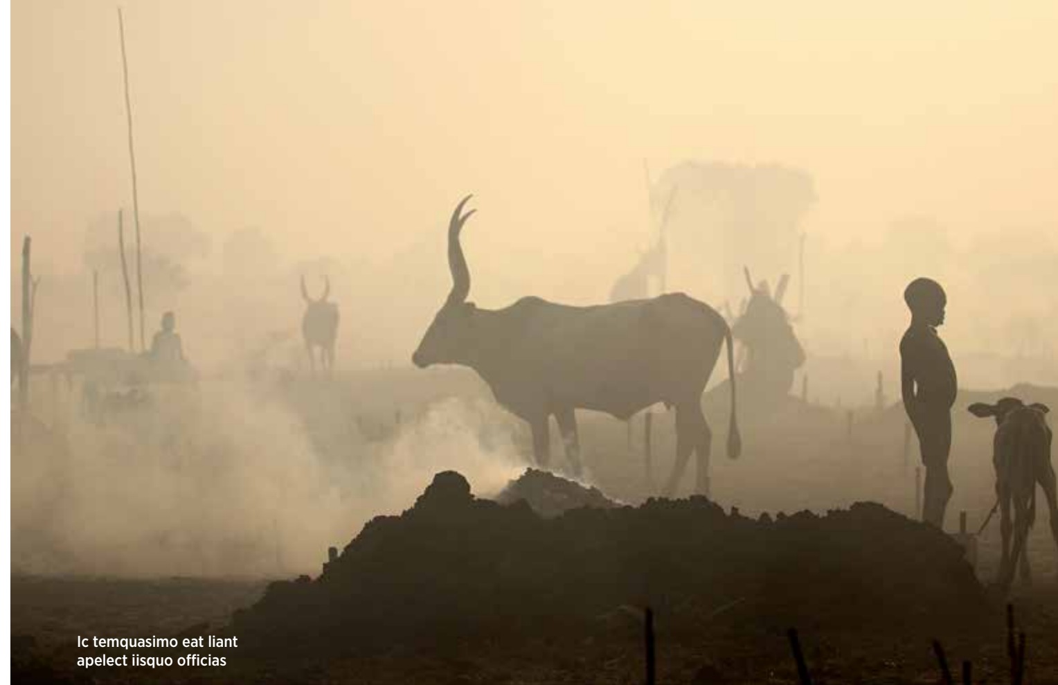
Ic temquasimo eat liant apelect iisquo officias