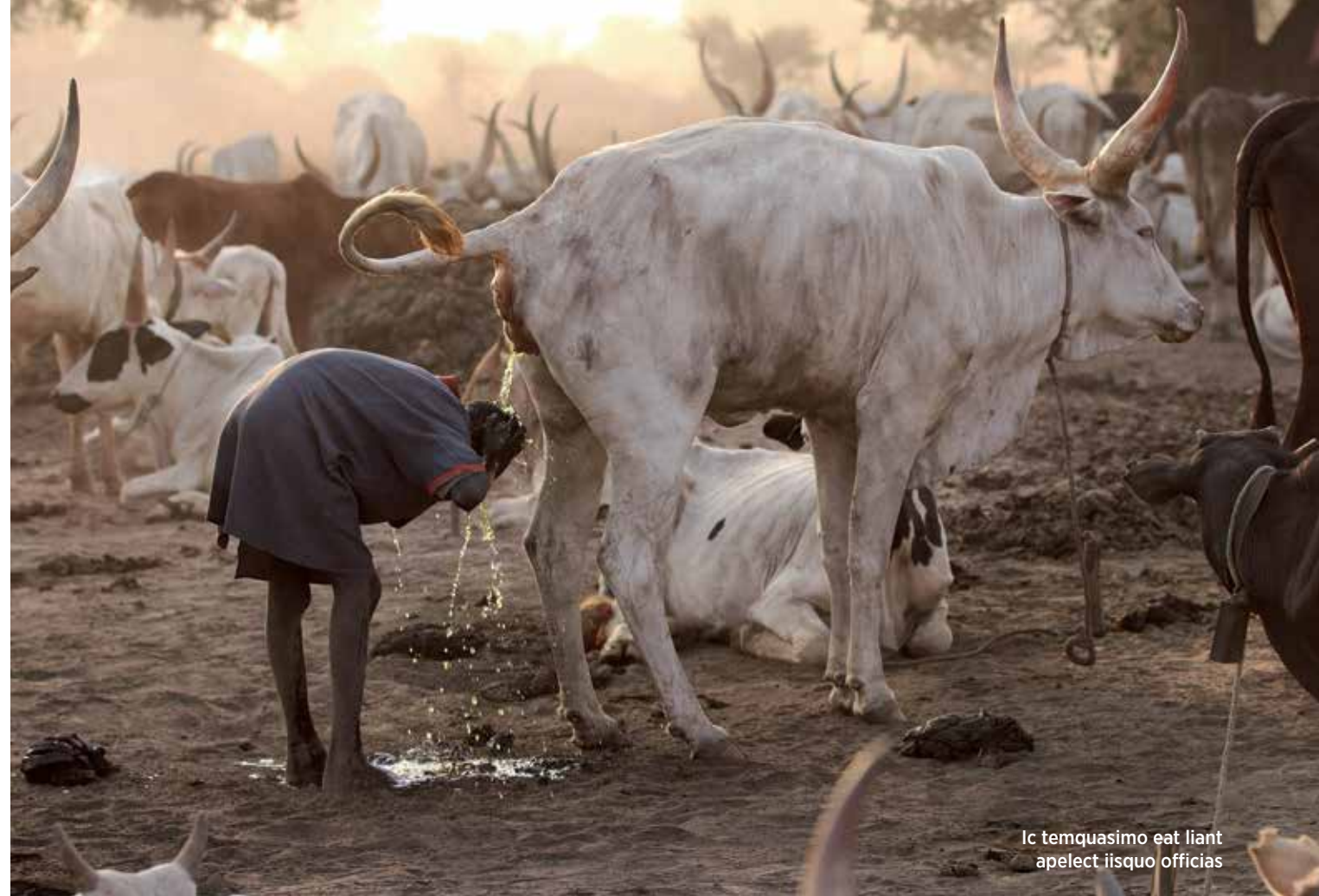
Ic temquasimo eat liant apelect iisquo officias

Jsem zde v období sucha a země je nesmírně horká. Nejen od silného slunce, ale také z neustále hořícího kravského trusu. Ten členové kmene každé ráno nashromáždí a nechají ho během dne vysušit. Odpoledne, před příchodem stád z pastvin, ho seberou a vytvarují v jakési provizorní pyramidy, které později zapálí. Kouř z hořícího trusu je tak intenzivní, že dokážu dýchat jen přes šátek. Působí však jako výborné ochranné antiseptikum. Vše zde má svou logiku. Popel navíc spolu s prachem využívají jako